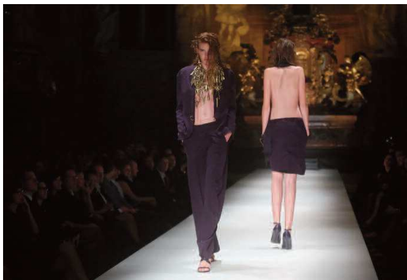
Premier Gala: A.F. Vandevorst