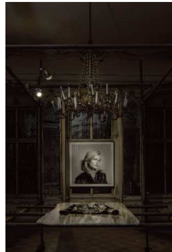
SAINT LAURENT SIMPLE CAROLLINUM CONCEPT STORE