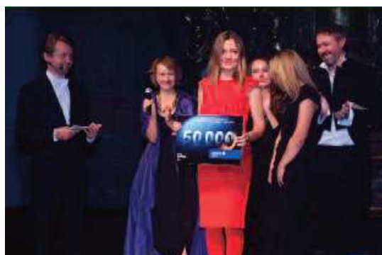
Premier Gala, předávání charitativního šeku