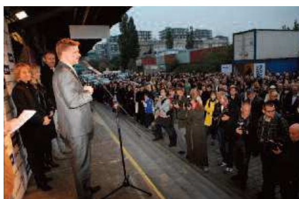
Slavnostní zahájení, Superstudio Nákladové nádraží Žižkov